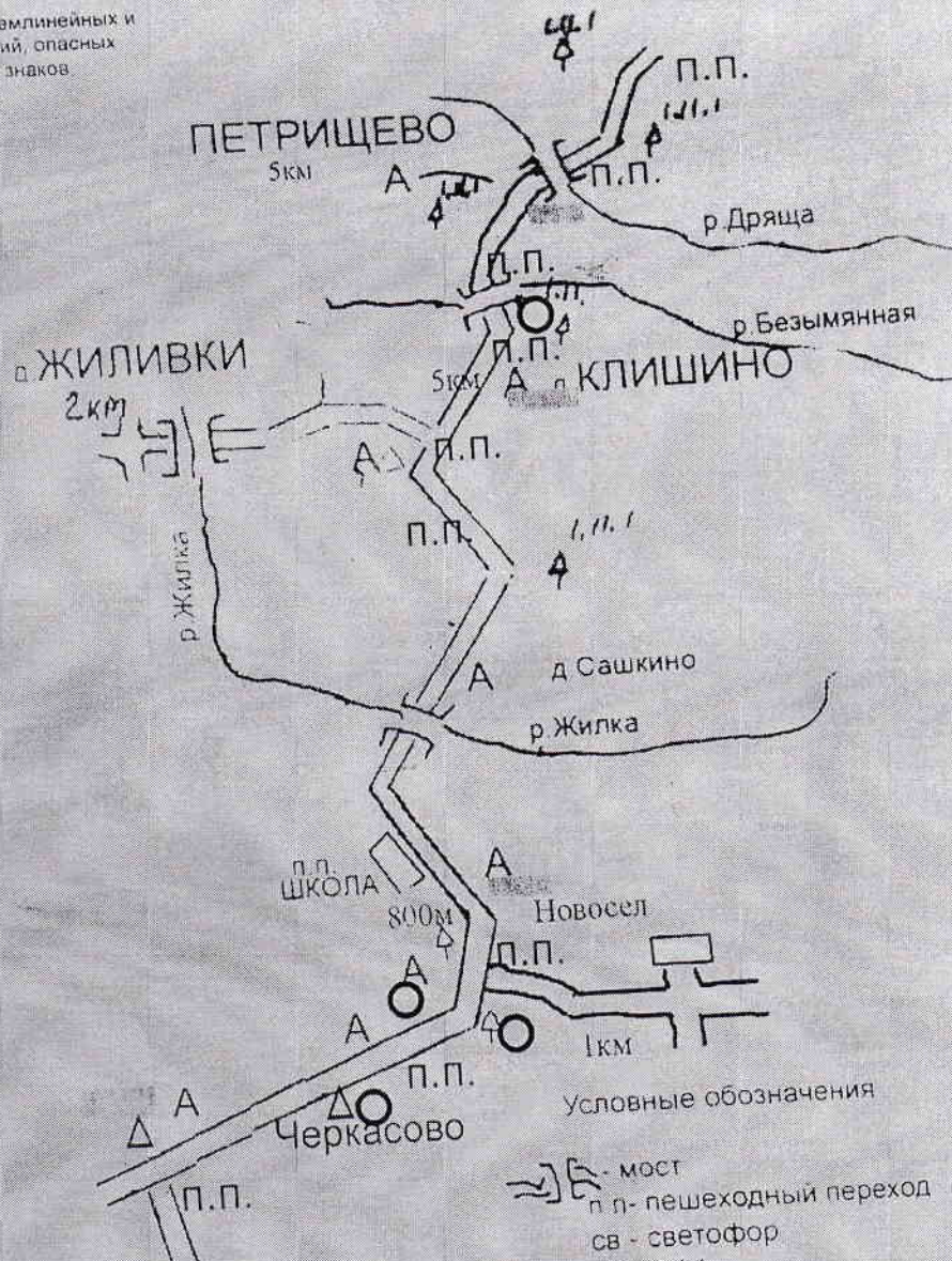
СХЕМА маршрута с указанием линейных и дорожных сооружений, опасных участков, дорожных знаков и пр. отраженность в км

Школа - Новосел 1,8 км - Черкасово 2,6 км Школа - Петрищево 10 км Сашкино - Новосел 3,7 км Трасса - Жиливки 2,1 км Сашкино - Петрищево 8 км